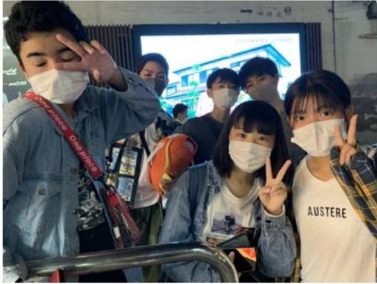
第 42 回 (2020. 11. 29) 箕面東高校 1 年生 ・ ・ 福井高校 3 年生 (1 年生 10 月の写真)