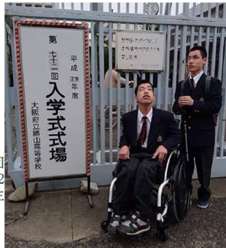
第 33 回 2017. 11. 12 勝山高校 1 年生

11 人のうちペーパーテストで 1 科目で 30 点以上取れそうな人 1 人? 2 人? 3 人? ほとんどの人は 0 点または一桁。 音声会話ができない (しない) 人 5 人。