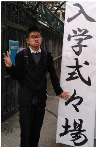
第 33 回 2017. 11. 12 桜塚高校定時制 1 年生