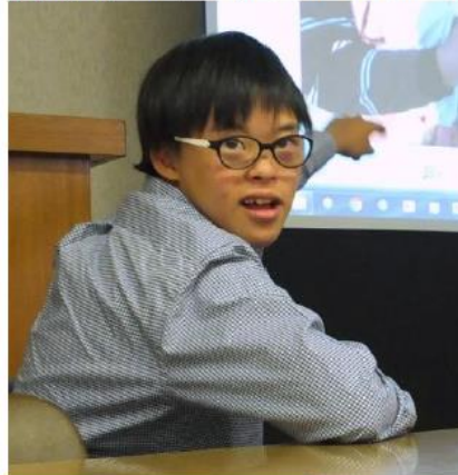
第 36 回 (2018. 10. 20) 福井高校 1 年生 (1 年生 4 月の写真)