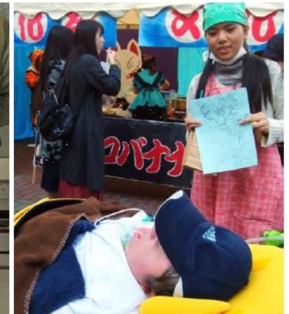
第 37 回 (2019. 5. 12) 城東工科高校卒業 ・ ・ ・ 春日丘高校定時制卒業