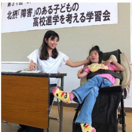
第 31 回 2017. 5. 20 福井高校 1 年生